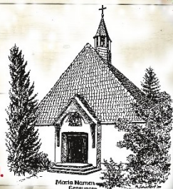
Mariae Namen Gensungen

In der Katholischen Kirche Mariae Namen, Heßlärer Straße 1 in Gensungen.